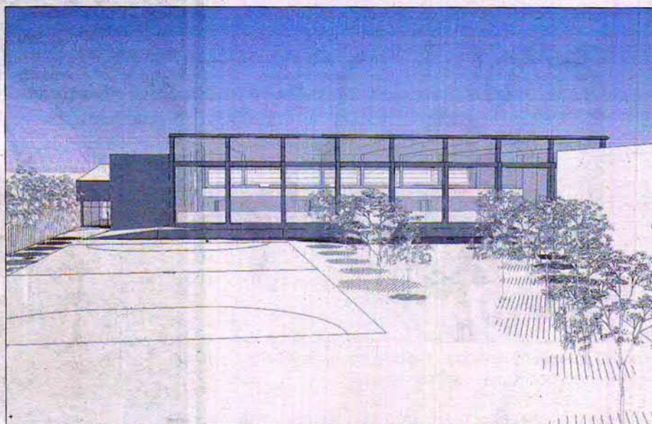
El nou pavelló de Montfalgars tindrà grans vidrieres a la part de l'escola